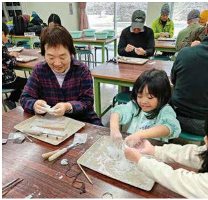
とびやま歴史体験館で匂玉づくり