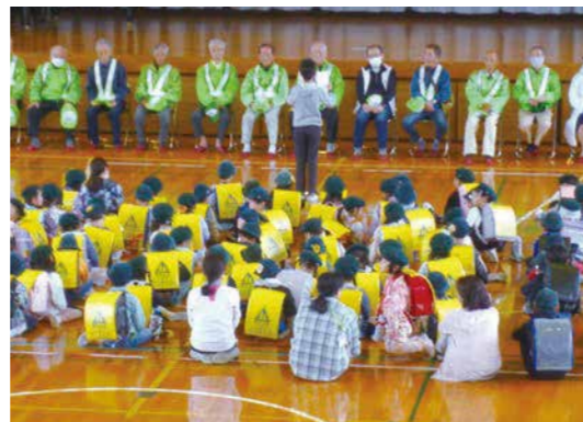
「いつもありがとうございます」