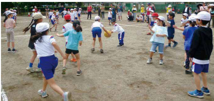
球技大会 5月26日(日)峰小校庭

4月24日(水) 峰小児童の安全を見守る防犯会をはじめとする地域の方々、児童との顔合わせの会がありました。