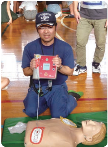
心肺蘇生(胸骨圧迫)とAED講習を受けて実習