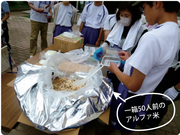
一箱50人前のアルファ米

峰小学校体育館または車中泊による訓練は初の試みです。宿泊訓練25名を含む参加者約100名が、防災士と救命救急士の講習を受けたのち、自らが考えて行動する実践的な訓練を行いました。 設営から炊き出しまで、お互いに協力し合い、地域や中学生ボランティアの助けを受けながら進められ充実した訓練となりました。