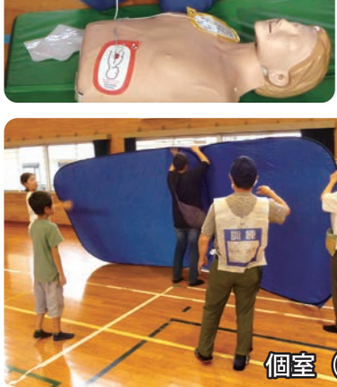
個室(防災キューブ)組立て⇒敷マットに空気を入れる⇒完成