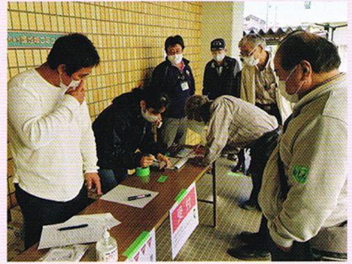
訓練の大切さを実感

災害時は、開設する側の人員の確保も欠かせません。近隣住民の協力が必要であることがわかりました。