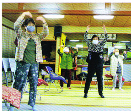
毎月第1・3月曜日 みんな元気に体操・脳トレ