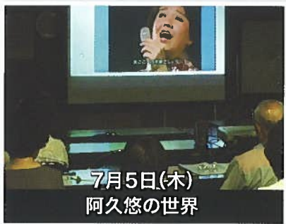
7月5日(木) 阿久悠の世界