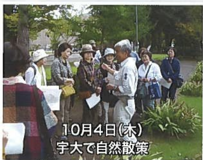
10月4日(木) 宇大で自然散策