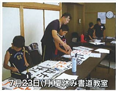
7月23日(月)夏休み書道教室