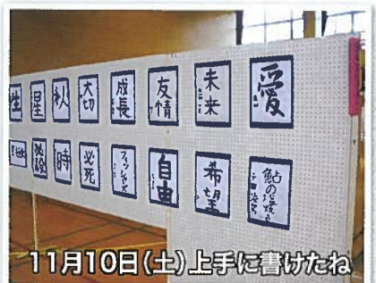
11月10日(土)上手に書けたね