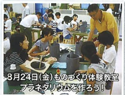
8月24日(金)ものづくり体験教室 プラネタリウムを作ろう!