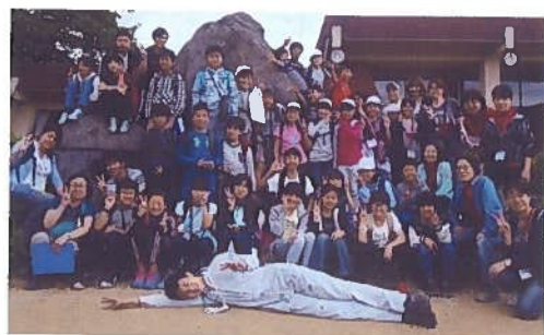
7月7日(土)~8日(日)野外宿泊研修 那須甲子少年自然の家にて 児童32名参加

9月29日(土)サイクリング&アウトドアッキングは、鬼怒橋の下でカレーを作りました。火おこし体験や水切り遊びも楽しみました。