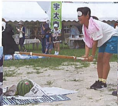
8月5日(日)宇大南自治会祭り