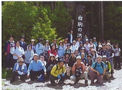
7月1日(日) 第30回ハイキング 長野県南佐久郡白駒の池