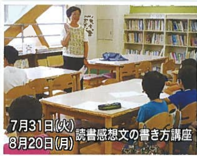
7月31日(火) 読書感想文の書き方講座 8月20日(月)