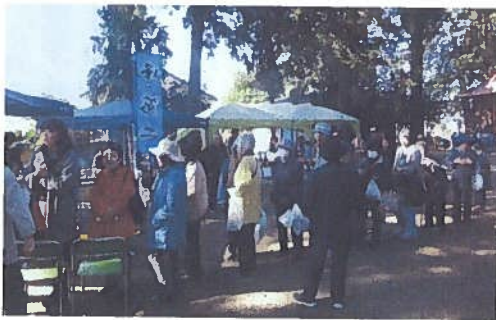
鶏峯神社秋季例大祭時に行う感謝祭 子どもたちもお手伝い